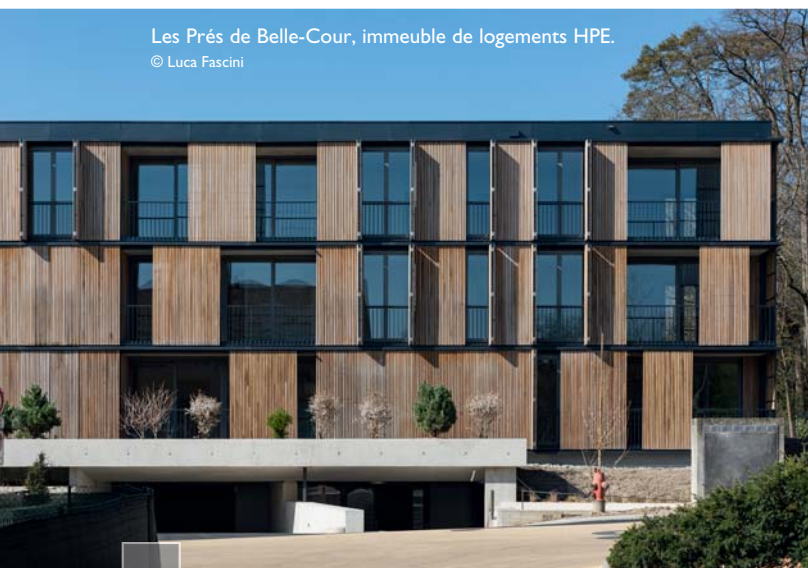
Les Prés de Belle-Cour, immeuble de logements HPE.

Après 3 années intenses passées à l'ouvrage, le bâtiment offre aujourd'hui un visage magnifié.