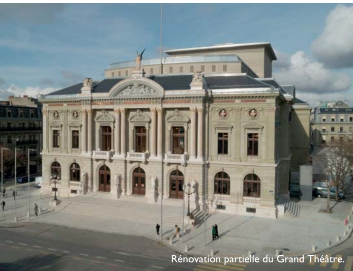
Rénovation partielle du Grand Théâtre.